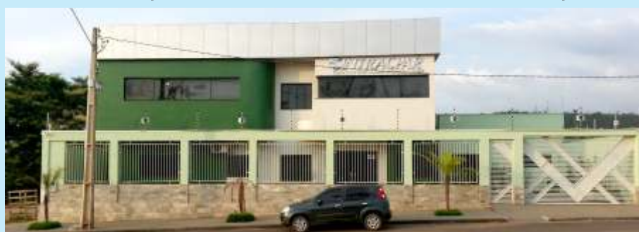
Nova sede escola