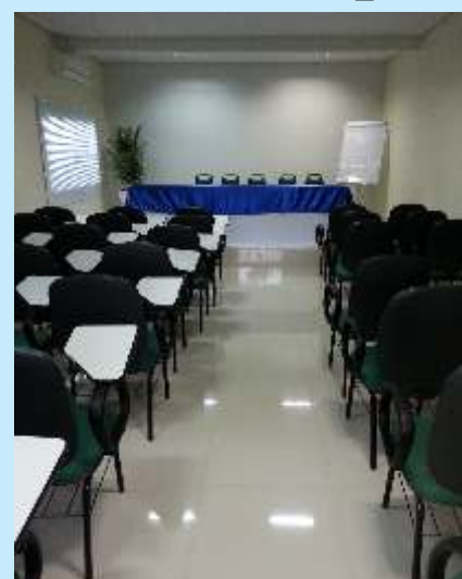
Auditório para 50 pessoas

EXPEDIENTE - Publicação do Jornal do Sindicato dos Trabalhadores no comércio de Parauapebas – SINTRACPAR. Filiado a FETRACOM – Federação dos Trabalhadores no Comércio dos Estados do Pará e Amapá, a CNTC – Confederação Nacional dos Trabalhadores no Comércio e a UGT – União Geral dos Trabalhadores. Sede própria: Rua João Figueiredo Qd. 33 Lts. 06.08.18.20 – Bairro Paraíso – Parauapebas Pará – CEP: 68.515-000, fone/fax: 094-3346-5799, 3346-3766 - email: sintrcpar@yahoo.com.br