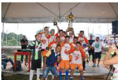
Supermercado Farturão ficou com o segundo lugar