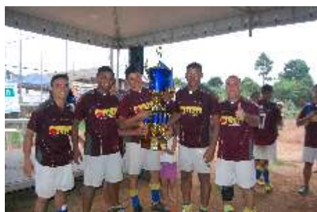
Equipe da Lival foi a grande campeã do torneio dos comerciantes