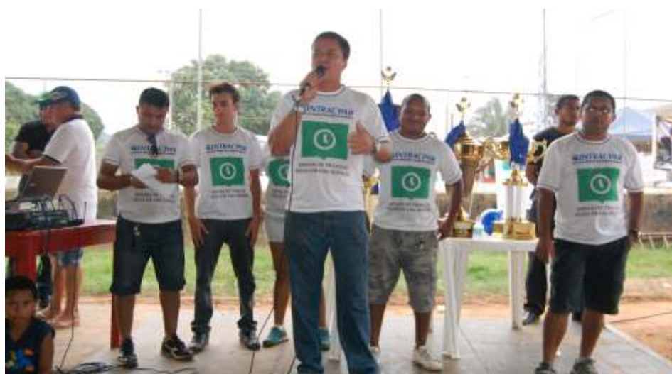
Diretoria do Sintracpar na entrega de troféus