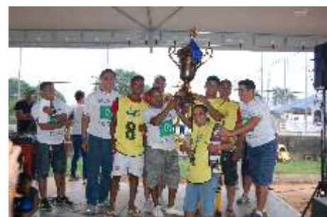
Representantes da Stilo Moveis receberam o troféu de terceiro colocado